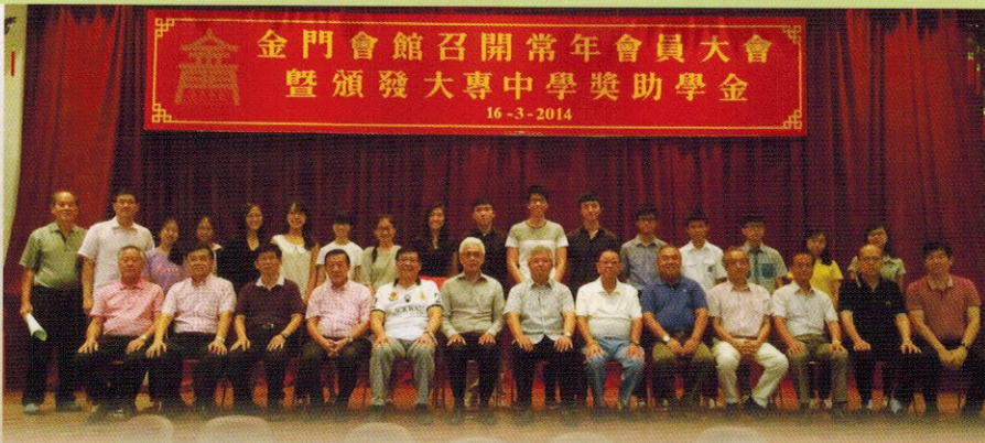
▲获奖的学生与董事们合影