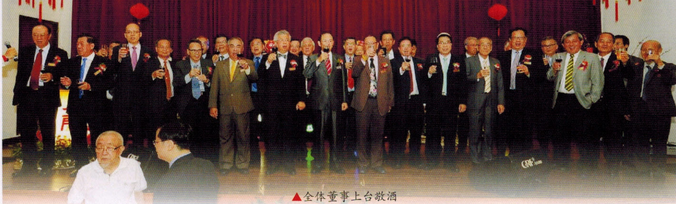
▲全体董事上台敬酒