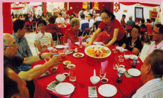
▲现场洋溢着浓厚的新春气息