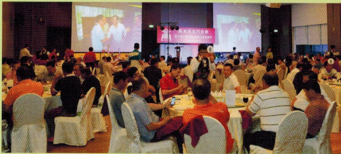
▲晚宴场面十分热烈

《金门杯》高尔夫球邀请赛获得圆满的成功。会馆邀请Neo Garden掌厨，特别的自助餐点，大家吃得开心，同时也提供卡拉OK，让出席者尽情的唱，其乐融融。