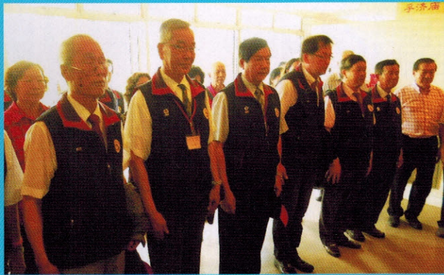
▲访问团在孚济庙向恩主公鞠躬致意