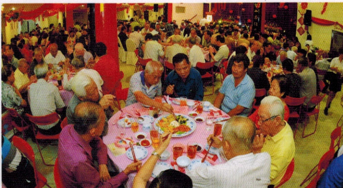
▲周年纪念晚宴，宴开40多桌