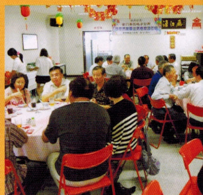
▲会馆设午宴款待代表团