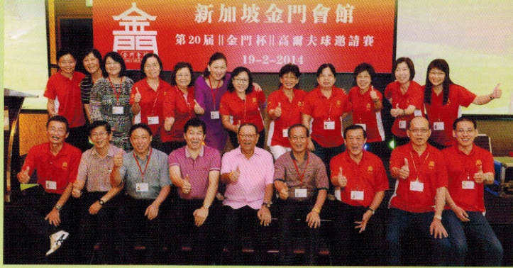
▲全体工作人员与董事拍照留念