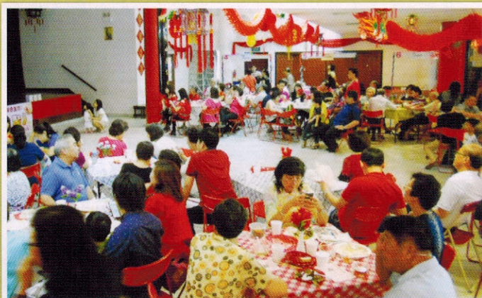
▲会场气氛欢愉热闹