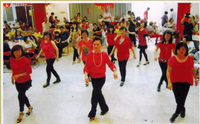
▲舞蹈班呈献动感十足的排舞表演