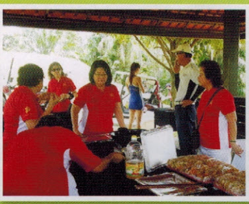
▲饮食与妇女组员们准备炸虾饼以慰劳参赛者