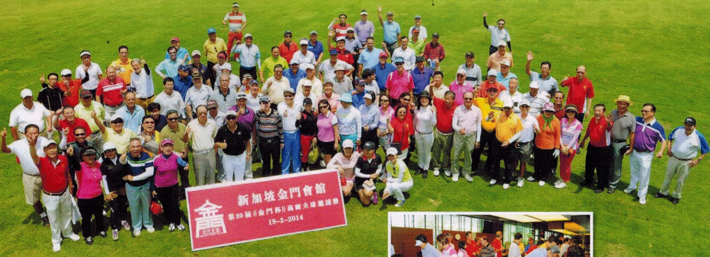
▲先礼后兵，参赛者在球场上拍全体照留念

为配合庆祝成立144周年纪念与推广高尔夫球运动，会馆于2月19日，假新加坡岛屿乡村俱乐部，主办第20届《金门杯》高尔夫球邀请赛，藉此让爱好此项运动的乡亲嘉宾，有机会切磋球艺，联络感情。