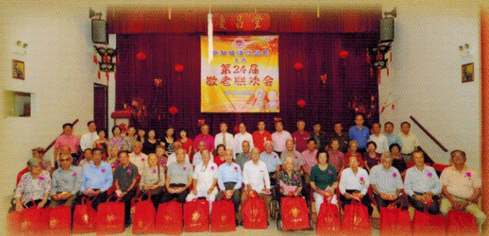
▲公会理事与嘉宾们及参与敬老活动的乡亲长辈们合照留念