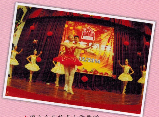
▲国立台北艺术大学舞蹈学院舞蹈团精湛的演出