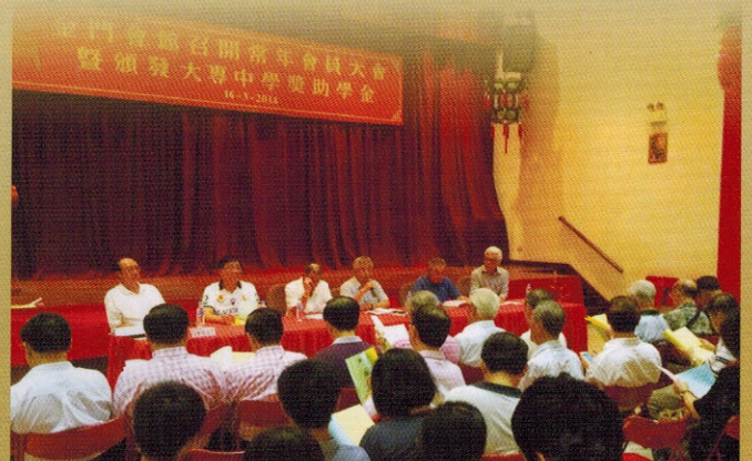
▲会馆召开会员大会