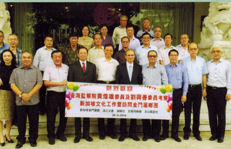
▲黄煌雄（前排右五）、刘兴善（右六）监察委员、谢发达代表（右七）与会馆董事及乡团代表合照留念

门离岛发展、及金门村眷文化保存的课题，不遗余力，同时协助推动金门申请世界遗产的准备工作。两位委员也先后发言分享推动金门申遗的过程，及结合海内外金侨的力量来推动相关的工作。最后大家互赠纪念品，以资留念，会馆设午宴招待嘉宾。黄祖耀主席也在3月28日接见和招待两位委员与江柏炜教授。