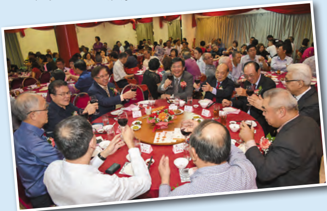
▲ 大家一起举杯欢饮