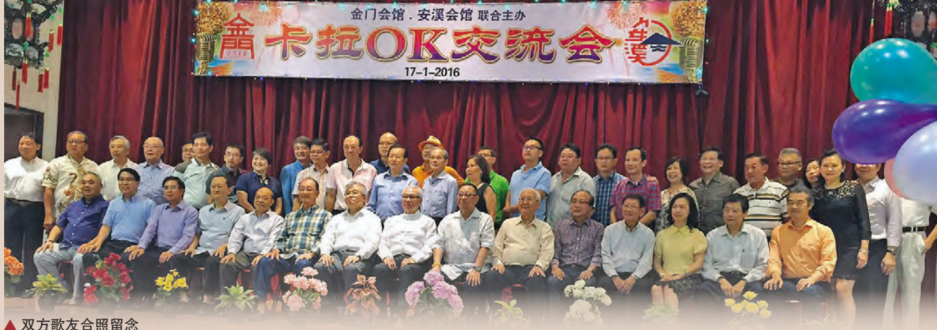
▲ 双方歌友合照留念