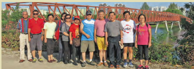
▲ 哈鲁士湿地附近合影

我们从另一端的出口离开科尼岛，沿着榜鹅水道回到起点。当时已是烈日当空，大家走得汗流浹背，最后顺利完成八公里的路程。