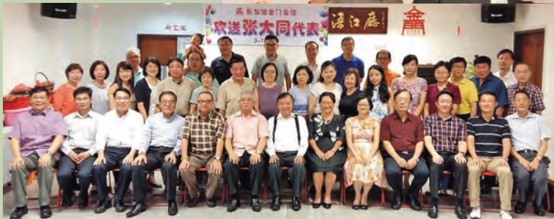
▲会馆董事、活动小组委员们与代表处张大同代表及代表处组长们合影