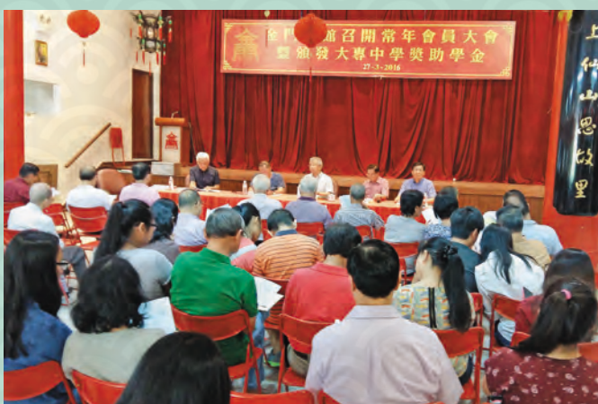
▲ 会员大会现场（摄于2016年3月27日）

会馆奖学金评选委员会，经于1月31日评选由会员子弟申请之2015年奖助学金申请表格，申请人数24名，获得批准有14名。