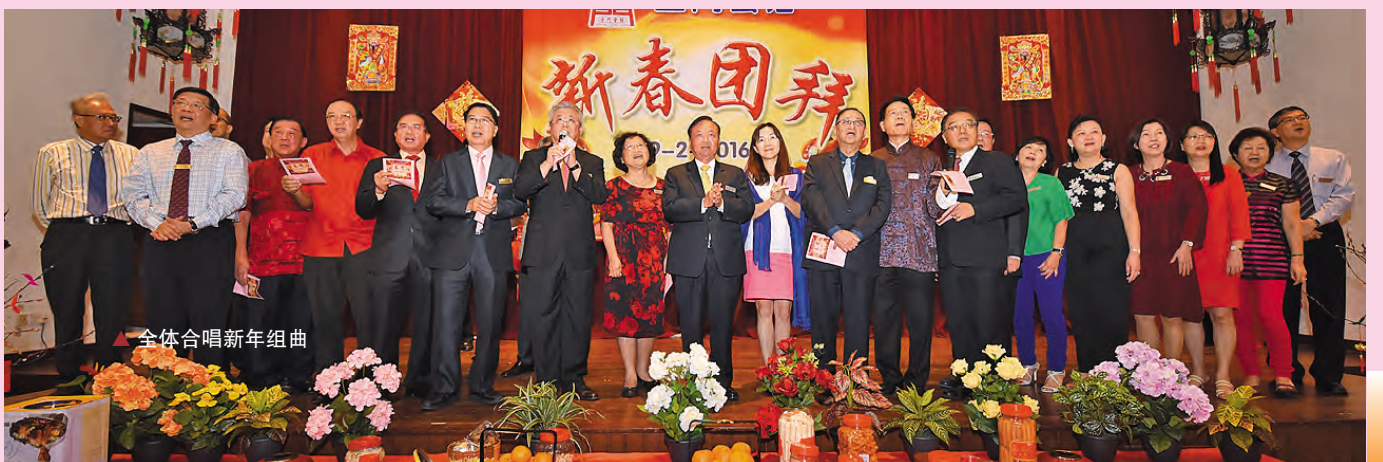
全体合唱新年组曲