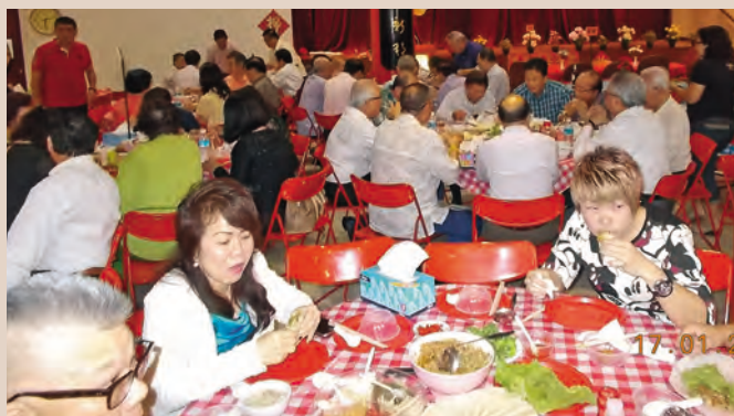
▲ 会馆安排金门薄饼招待嘉宾