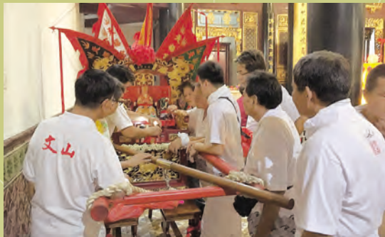
◀文山社友为妈祖安座

天福宫为庆祝妈祖圣诞，于4月26至29日举行了一系列的庆祝活动。4月29日（农历3月23）晚上，举行迎神赛会活动，邀请文山联谊社参与。文山借出妈祖神轿，轿为迎神赛会时，妈祖乘坐的圣座。文山并出动40位社友，负责为妈祖安座与扛轿等工作。一轮祭拜后，游行队伍由文山社友肩扛神轿，带领舞狮、旗队、锣鼓队、众香客等，非常壮观。扛轿者配合锣鼓的节奏，同步摇摆，表达对神明的尊敬之意，游行队伍引来无数旁人驻足观看。