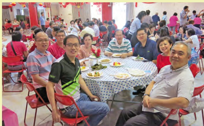
▲ 会场欢乐一堂、其乐融融