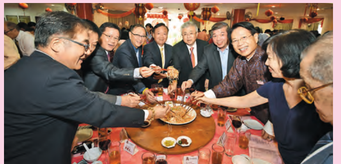
▲大家一起捞鱼生，捞个风生水起