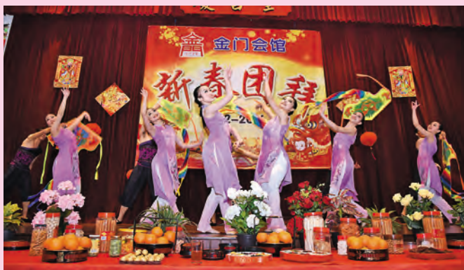
▲台湾文化大学华冈舞蹈团精湛的舞蹈表演