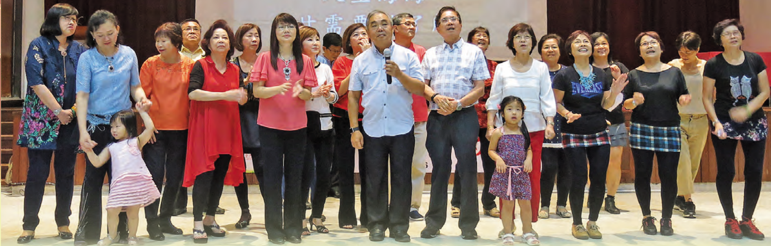
▲ 全体大合唱《欢喜就好》