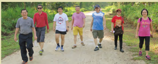
▲ 科尼岛上绿意盎然