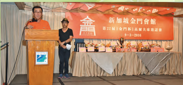
▲ 高尔夫球邀请赛工委方得岫主任致欢迎词