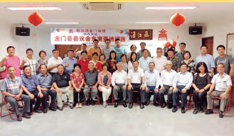
▲出席宴席的董事们与金门县议会访问团合影留念