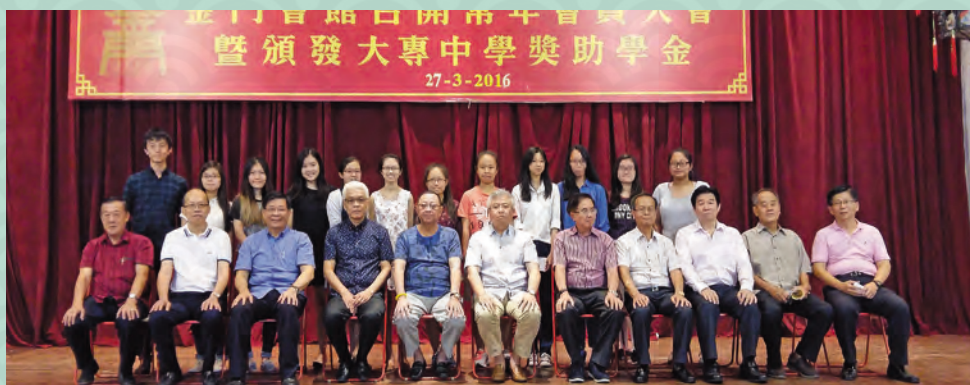
▲ 会馆董事与获颁奖学金的同学们合影