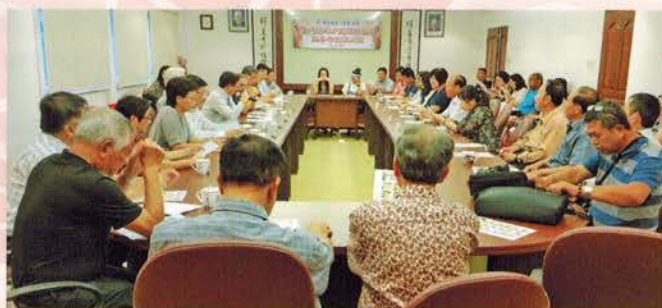
▲在会议厅举行交流会