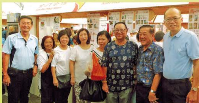
▲ 部分董事与工作人员合影