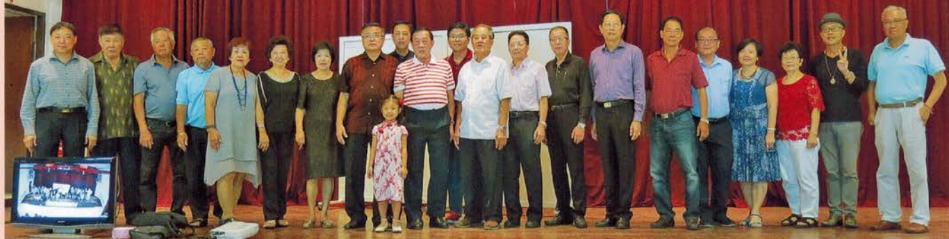
▲ 参与卡拉OK演唱的金门会馆与乡团代表