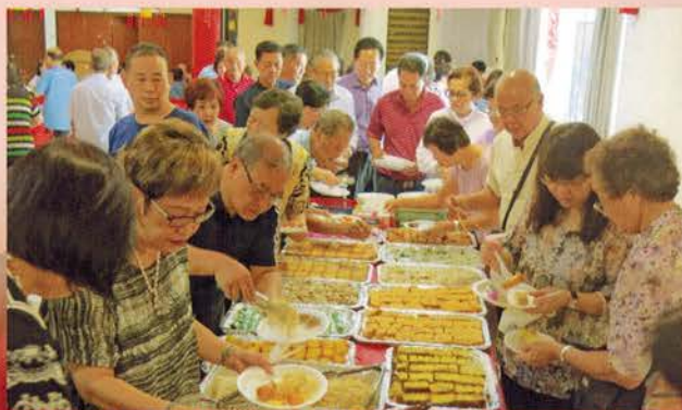
▲ 乡亲们享用美味午餐