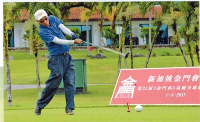
▲ 方得岫董事挥杆的英姿