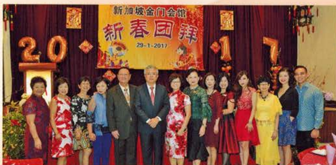
▲ 宾客们盛装出席新春团拜