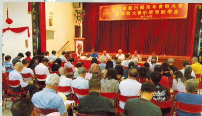
▲ 出席会员大会踊跃场面