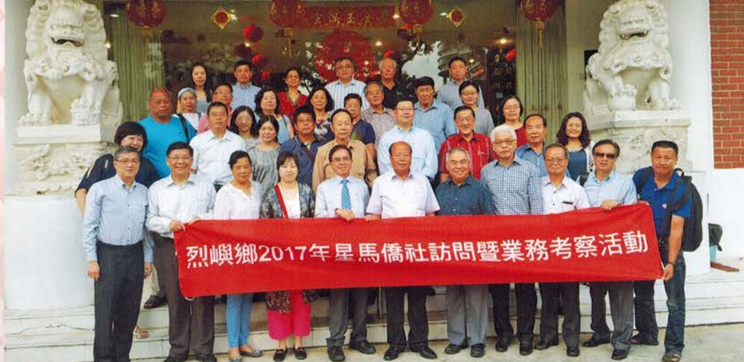
▲会馆董事与烈屿星马侨社访问团一行人合影

金门会馆设晚宴款待，双方互赠纪念品。现场气氛温馨欢愉，大家都陶醉在浓浓的乡情里。