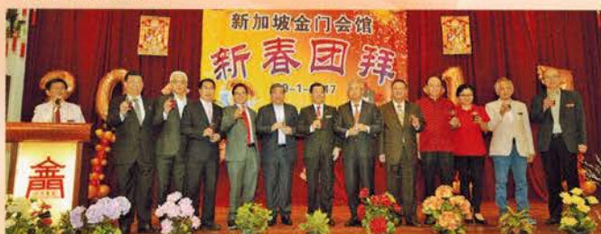
▲ 举杯敬酒，祝来宾们身体健康、万事如意！