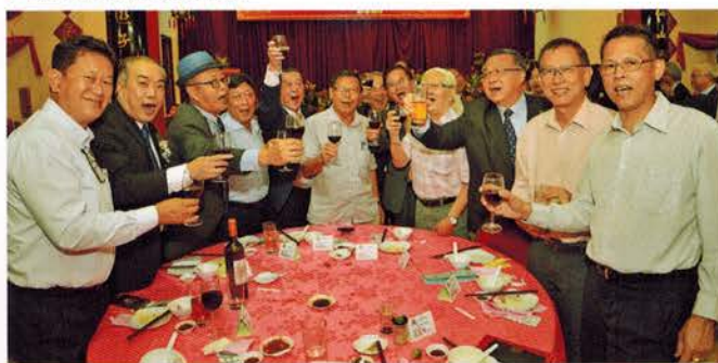
▲ 周年纪念热闹场面