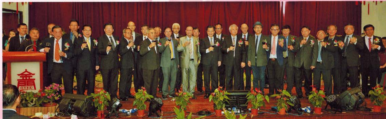
▲ 全体董事向嘉宾、会员敬酒