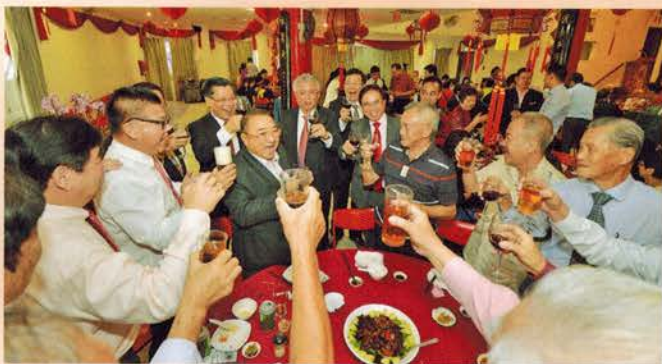
▲ 相聚时刻，快乐时光