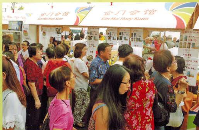
▲ 金门会馆美食摊位前人潮汹涌