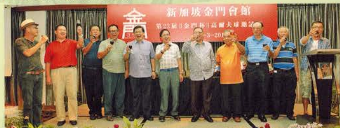
▲ 筹委会全体委员向来宾们敬酒