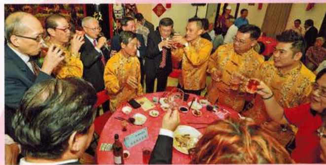
▲ 董事们殷勤地向来自柔佛州金同厦会馆的贵宾们劝酒