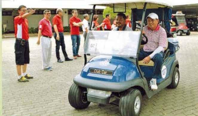
▲ 出发咯！高尔夫球赛开始