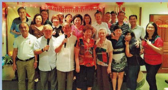
▲ 古甯同乡会欢乐卡啦OK聚会

另外，古甯同乡会借助科技之力，请专人设立网站，网址为： http://kohleng.org/ ，希望通过网际网络传播，吸引年轻人的参与活动并加入乡团组织。