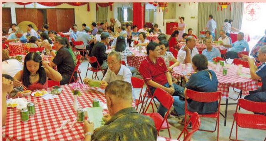
▲ 双亲节热闹的场面