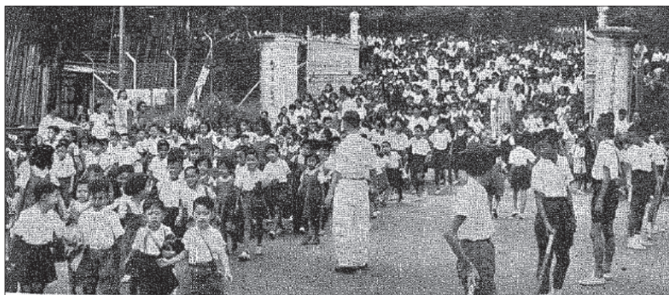
—— 本校放學時一瞥 ——