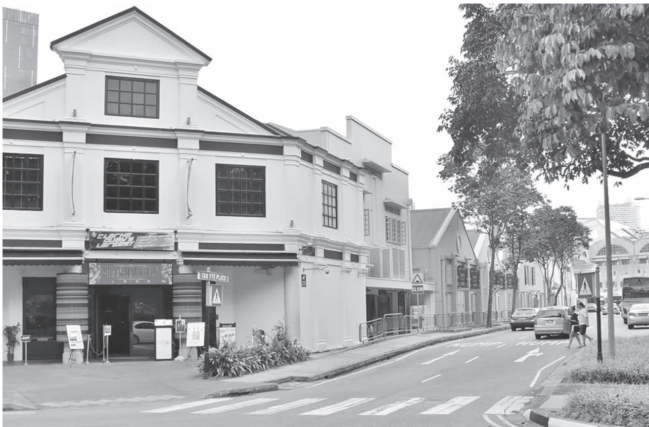
位于克拉码头附近的陈泰坊(Tan Tye Place)。